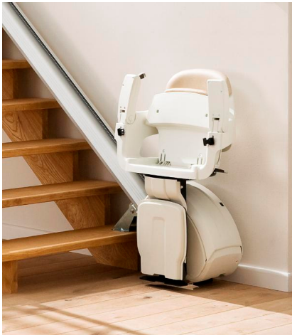
Platz sparend geklappt