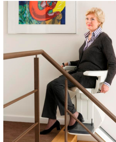
Dreh-Sitz für sicheren Ausstieg